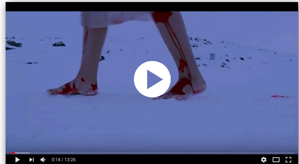
“The other side”